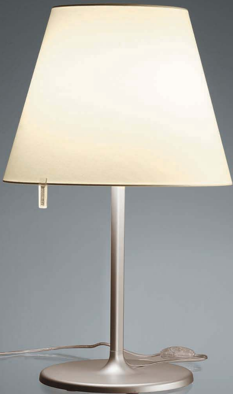
melampo tavolo, bronze / ecrù