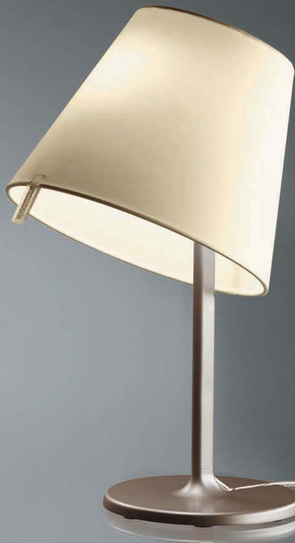
melampo notte, bronze / ecrù